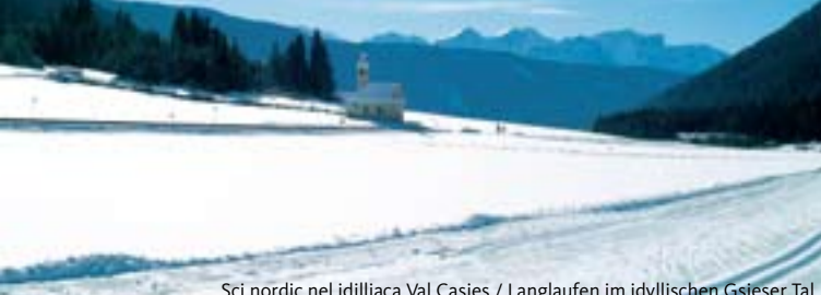
Sci nordic nel idilliaca Val Casies / Langlaufen im idyllischen Gsieser Tal

R. Bergmann (solo sci di fondo/only cross-country skiers/nur Langlaufski) Colle/Val Casies - Pichl/Gsieser Tal - Bar Restaurant/Ristorante Binta Pub - Tel. +39 329 1 745 154