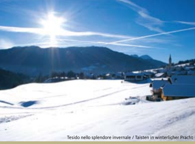
Tesido nello splendore invernale / Taisten in winterlicher Pracht

DT Der weite, sonnige Talboden des Gsieser Tales eignet sich hervorragend, um im Winter Langlaufloipen zu ziehen. Ob für den Skater oder für den klassischen Läufer, es ist für jeden Platz auf der 42 km langen Loipe von Welsberg über Taisten ins Gsieser Tal. Bei guten Schneeverhältnissen erreicht man mit den Skiern auch Taisten und Welsberg, von dort aus kommt man auf die Anschlussstrecke der Pustertaler Skimarathon-Loipe. Mit schneesicheren Pisten kann von Weihnachten bis Mitte März gerechnet werden und die Loipe bietet für jeden Geschmack und jede Kondition ausreichend Möglichkeiten. Wer auf den schmalen Brettern noch nicht so ganz sicher ist, kann sich unter kundiger Anleitung das richtige Langlaufen in den Ski-schulen in St. Magdalena und Taisten Guggenberg aneignen.